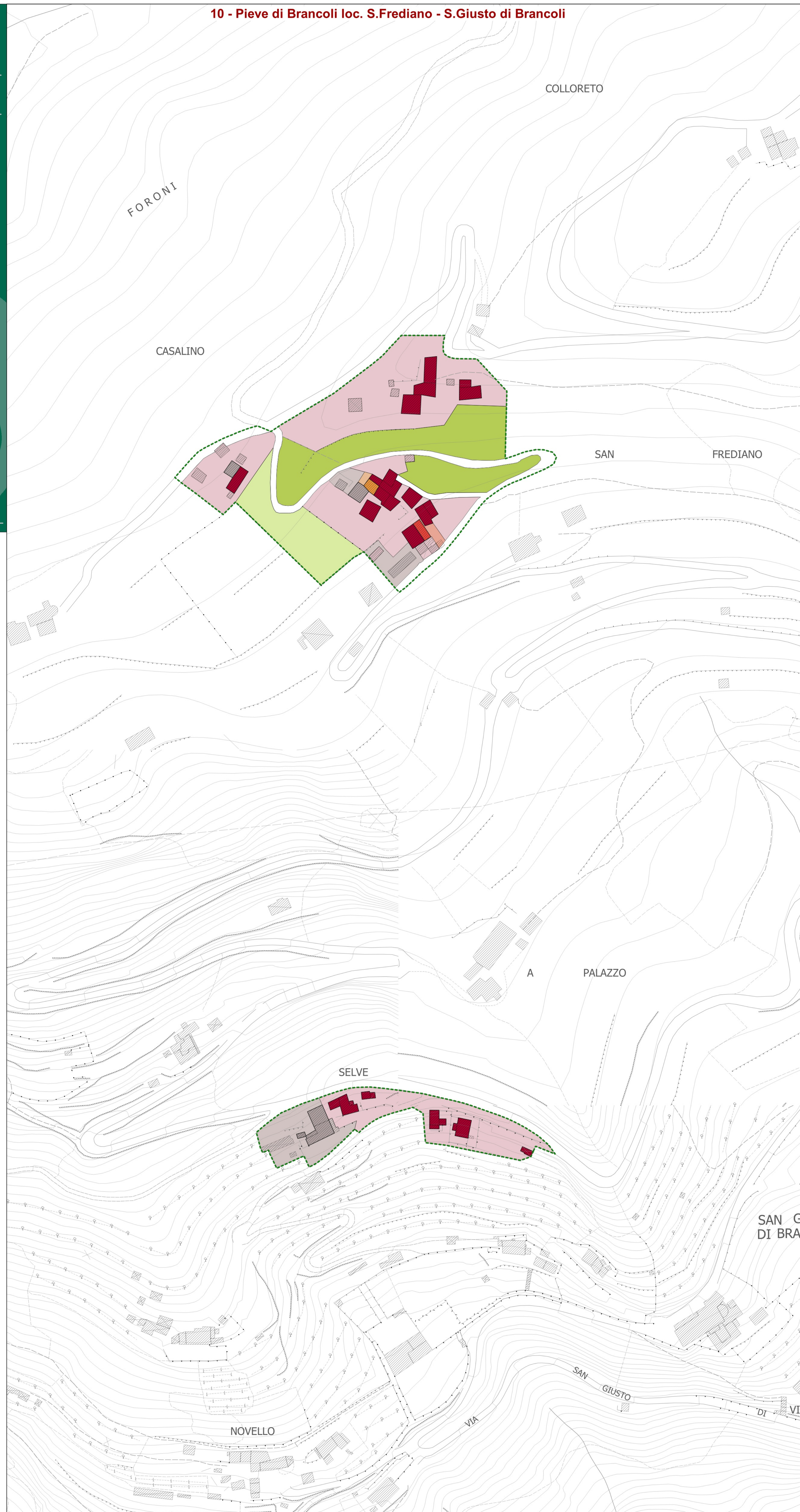
10 - Pieve di Brancoli loc. S.Frediano - S.Giusto di Brancoli